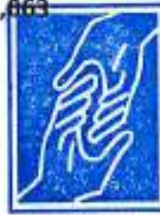
جمعية ايادي الرحمة الانسانية مفتحة لغير حكومية Mercy Hands Public Humanitarian Aid ٢٠٢٢